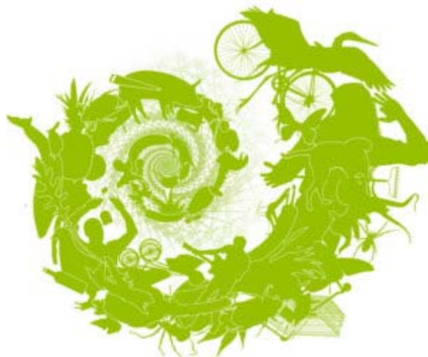
Planet Diversity Logo

Bonn (pte/15.05.2008/16:47) - Seit 12. Mai ist Bonn Schauplatz eines Ringens zwischen der UNO und der Zivilgesellschaft. Während offizielle Stellen über konkrete Umsetzungsschritte des 1999 ausverhandelten Cartagena-Protokolls http://www.cbd.int/mop4 diskutieren, veranstalten die bekanntesten Gentechnik-Kritiker aus aller Welt im Rahmen der "Planet-Diversity-Konferenz" http://www.planet-diversity.org eine Art "Gegengipfel". Darin wollen sie ihre klare Haltung zur Verbannung der Gentechnik von den Äckern und Tellern bekräftigen.